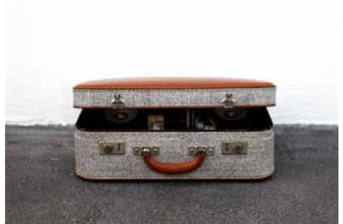
Emma Dusong, Valise (numéro1) , 2012, Coll. FRAC Languedoc-Roussillon

. Conférence : «Romantisme : le poème, art de tous les arts, langage à la frontière de la musique, exprimé en particulier par le lied» avec André Scala, philosophe.